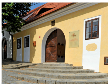
Rodný dům Mistra Jana Husa